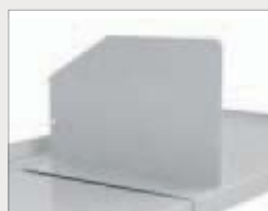
Bokstøtte for plan hylle