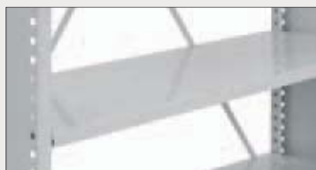
Plan hylle (maksbelastning 75 eller 150 kg)