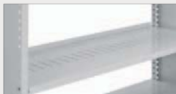
Hylle for skilleplater