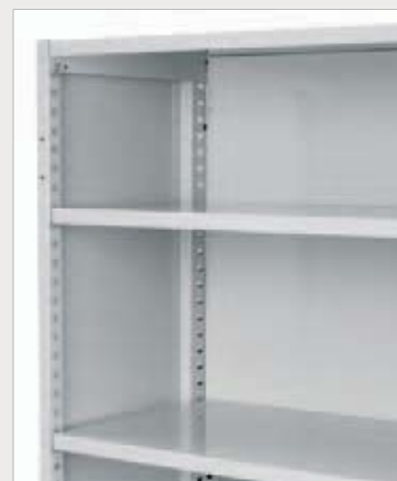
Tett rygg til arkivreol

Et meget solid og funksjonelt hyllesystem for oppbevaring av arkivpermer, kontorutstyr, papir, rekvisita osv. Gjennom stor variasjon av hylledybder, kapasitet og tilvalg sikres optimal utnyttelse av lagerrommet - tilpasset ditt behov. I de ferdige definerte grunn- og følgefagene har hyllene en lastegrense på 75 kg, tilfredsstillende for å få orden på de fleste lagerbehov.