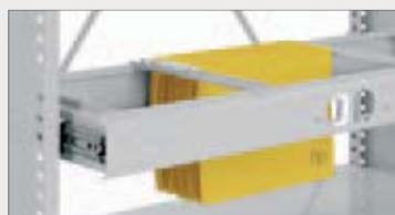
Uttreksramme for hengemapper